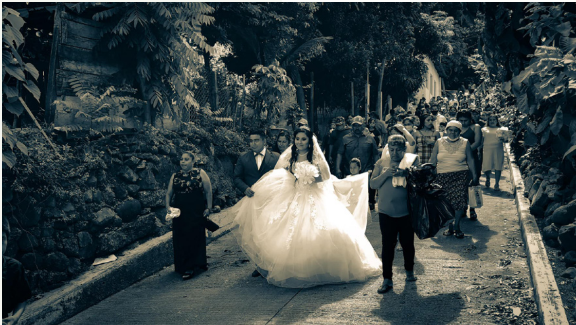
Boda nahua en Tatahuicapan